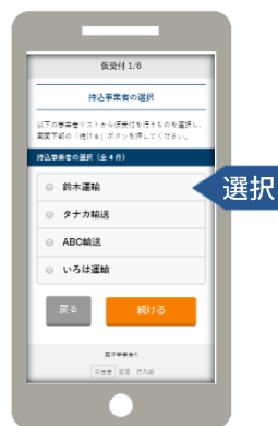
持込事業者を選択

バッテリーの持込事業者により「解体依頼」が入力されていて、かつ、まだ実績の入力が行われていなければ、解体事業者の“重量計量”を担当する方は「持込事業者」を選択することで計量の結果をその場で直接、入力（メモ）することが出来ます。入力された内容はPCのシステムから確認することが可能です。