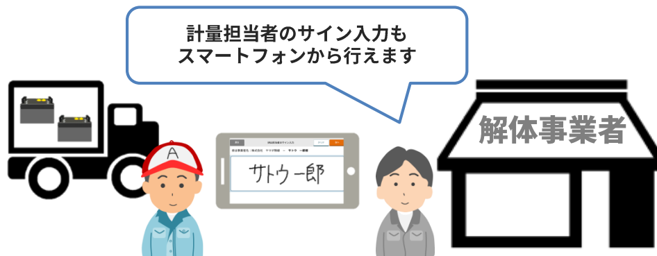
「重量の計量結果」のメモが その場で行うことができる